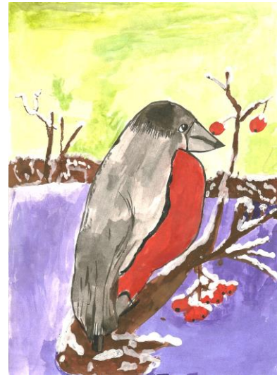
Рис. Докторовой Юли