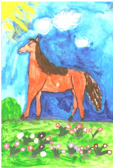
Рис. Мяло Евгении

Школьный прозвенел звонок, И окончился урок. Я о чем-то замечталась, В классе вмиг одна осталась. И пришлось бежать опять Пятый класс свой догонять. Со звонком решать задачи, Упражненья выполнять, На кружке конька лепить... В школу я люблю ходить!