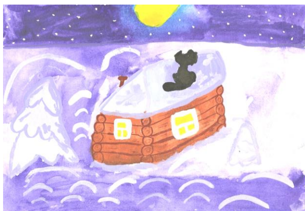
Рис. Минина Павла

Моя родина славная , Свет златистый погас. Плачет речка серебряная В этот грустный час. Огоньки родимые К сердцу сладко льнут. Детки непослушные Все никак не уснут.