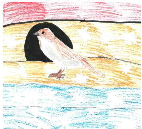
Рис. Рудакова А