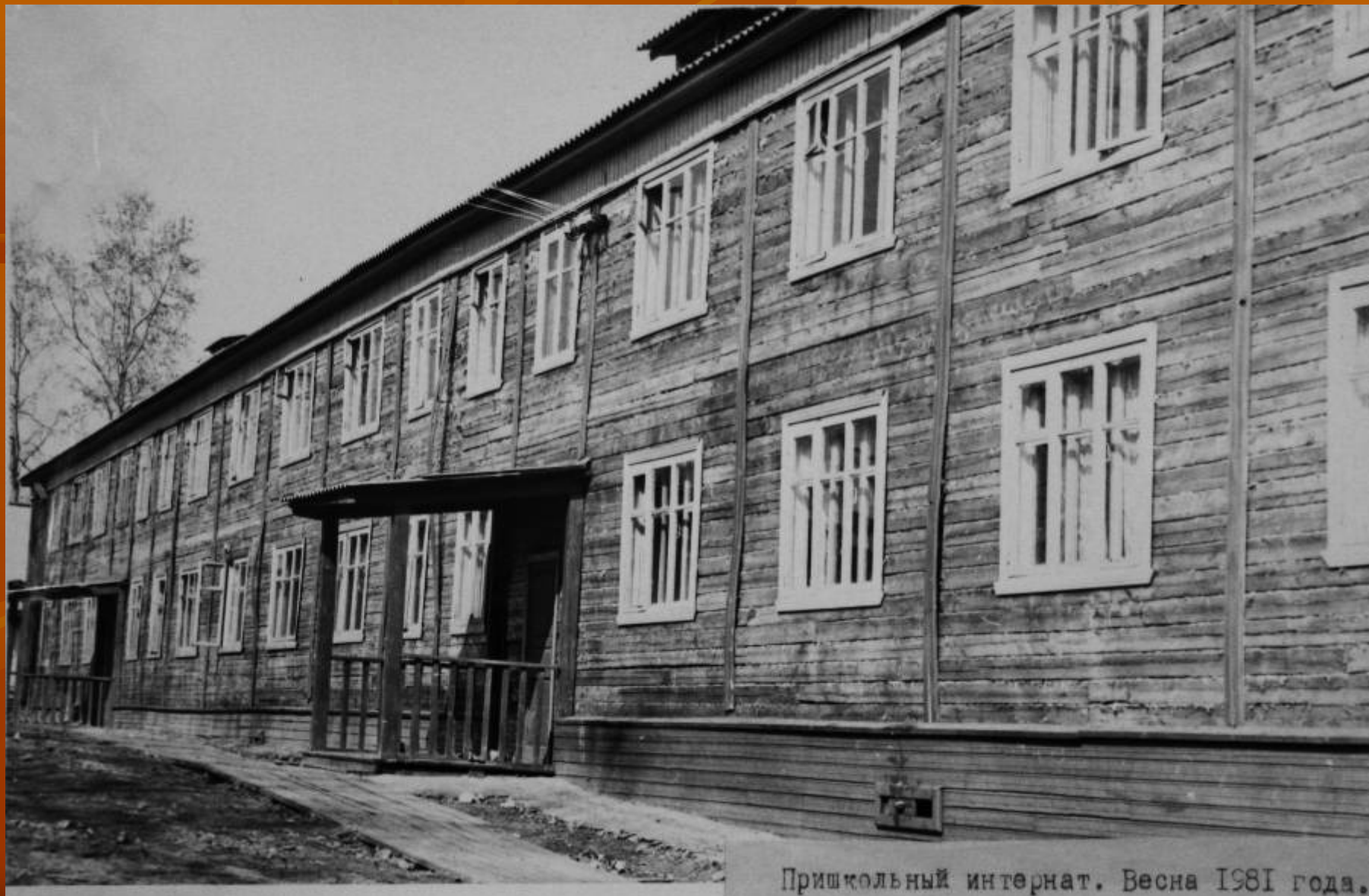
Пришкольный интернат. Весна 1981 года.